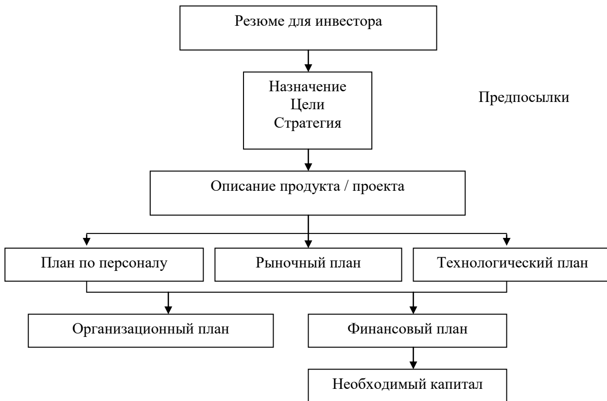
Рис. 1. Структура типового бизнес-плана

Элементы структуры бизнес-плана представлены на рисунке.