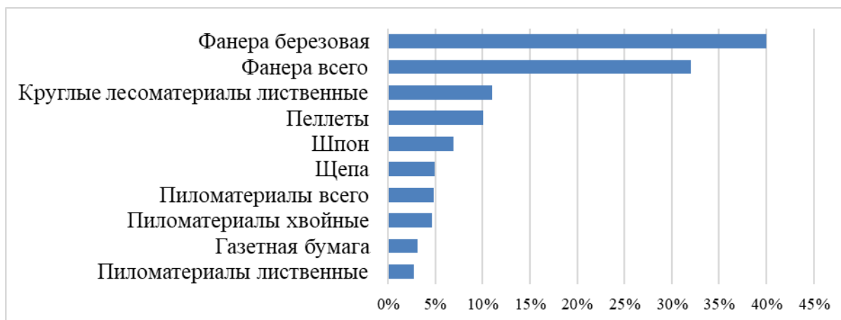
Рис. 2. Доля российской лесной продукции в общем объеме потребления на рынке стран ЕС